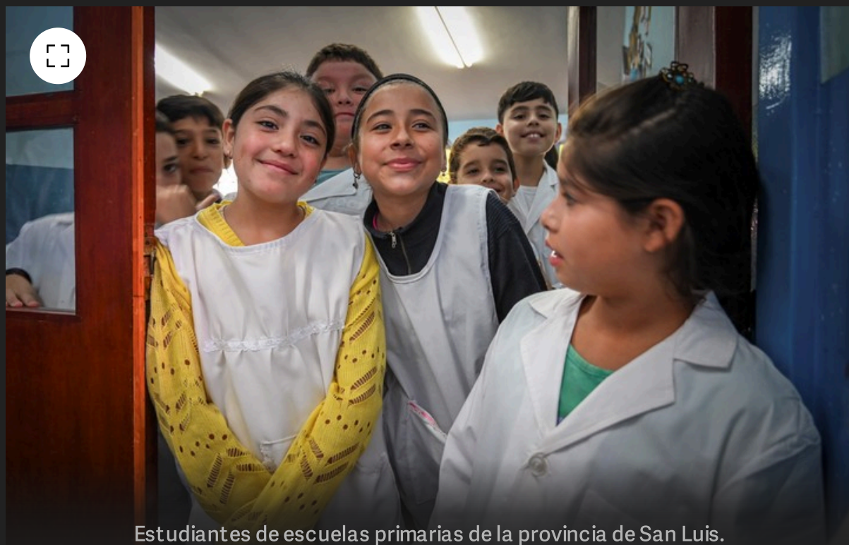
Estudiantes de escuelas primarias de la provincia de San Luis.

intensiva a 100 referentes , que eran docentes o docentes jubilados. Esos referentes después fueron a las escuelas a acompañar a los maestros que están frente al aula.