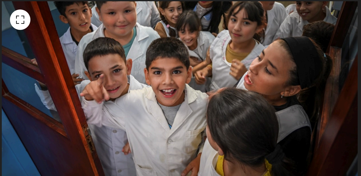
Estudiantes de escuelas primarias de la provincia de San Luis.