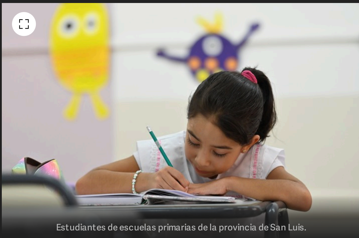
Estudiantes de escuelas primarias de la provincia de San Luis.

Para medir esa progresión, el equipo de Borzone diseñó una evaluación especial , que rastrea el avance a lo largo de todo el ciclo básico de la escuela primaria (de primer a tercer grado). Esa evaluación se toma, en todos los grados, al comienzo y al finalizar cada ciclo lectivo .