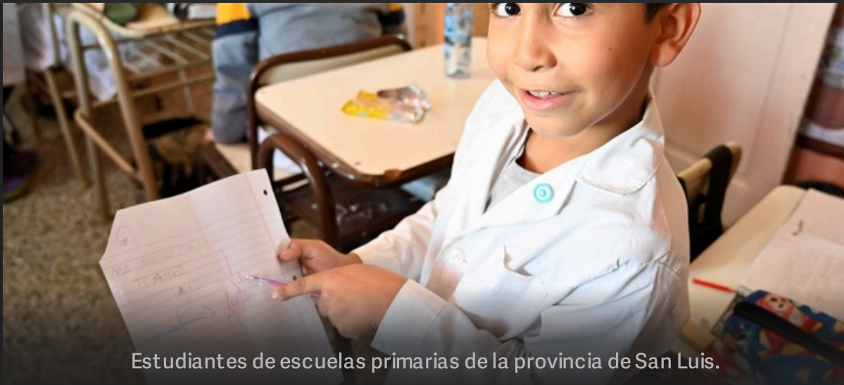
Estudiantes de escuelas primarias de la provincia de San Luis.

En escritura , en tanto, en primer grado el 89,8% no alcanzaba las habilidades básicas en 2025. Hoy esa cifra se redujo al 70,1% . En segundo grado, sólo el 13,6% de los alumnos permanece por debajo del nivel mínimo. Y en tercer grado, los estudiantes que alcanzan el nivel óptimo pasaron del 40,2% al 83% en un año .