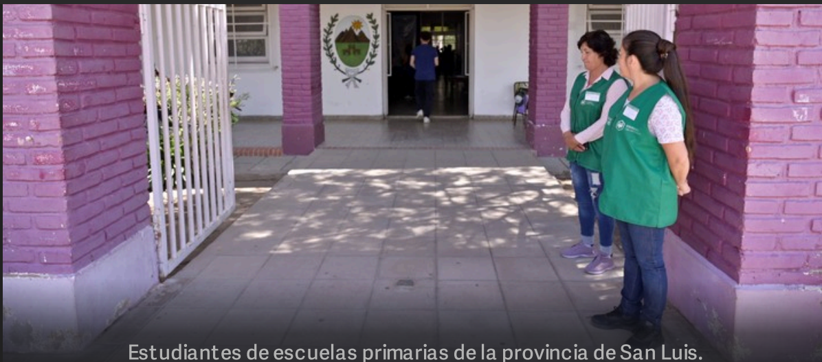
Estudiantes de escuelas primarias de la provincia de San Luis.