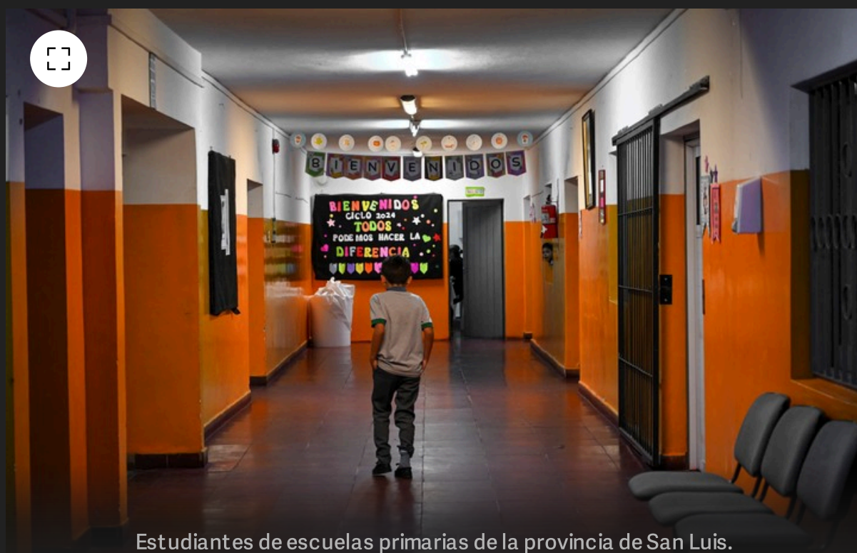
Estudiantes de escuelas primarias de la provincia de San Luis.

La evaluación de San Luis califica a los alumnos en tres niveles: No alcanzó, Mínimo y Óptimo . Los conocimientos para llegar a esos niveles varían de acuerdo al grado que está cursando cada alumno.